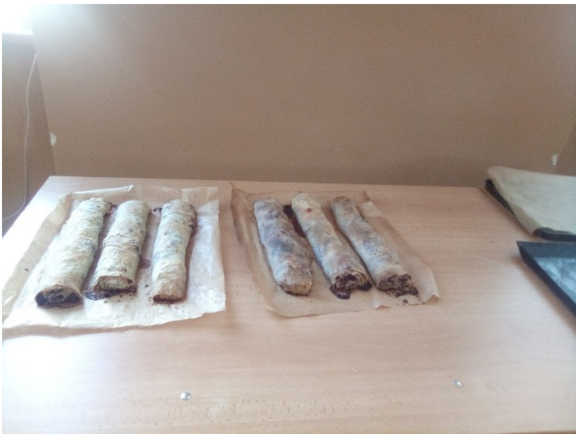
Hotové upečené makové a orechové štrúdlé