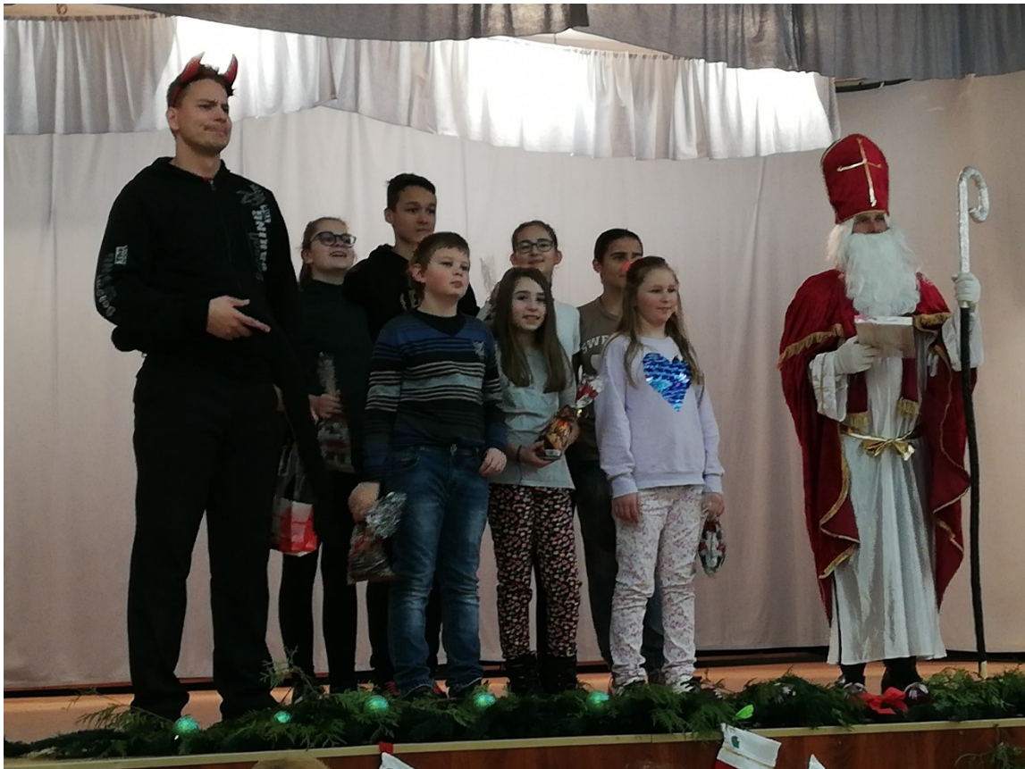
Členovia detského divadelného súboru Pod vežičkou a účinkujúci na slávnostnej členskej schôdzi a Mikulášskom posedení v divadelnej hre „Podte s nami čakať Mik – mik – miki – mi – guláš ...“