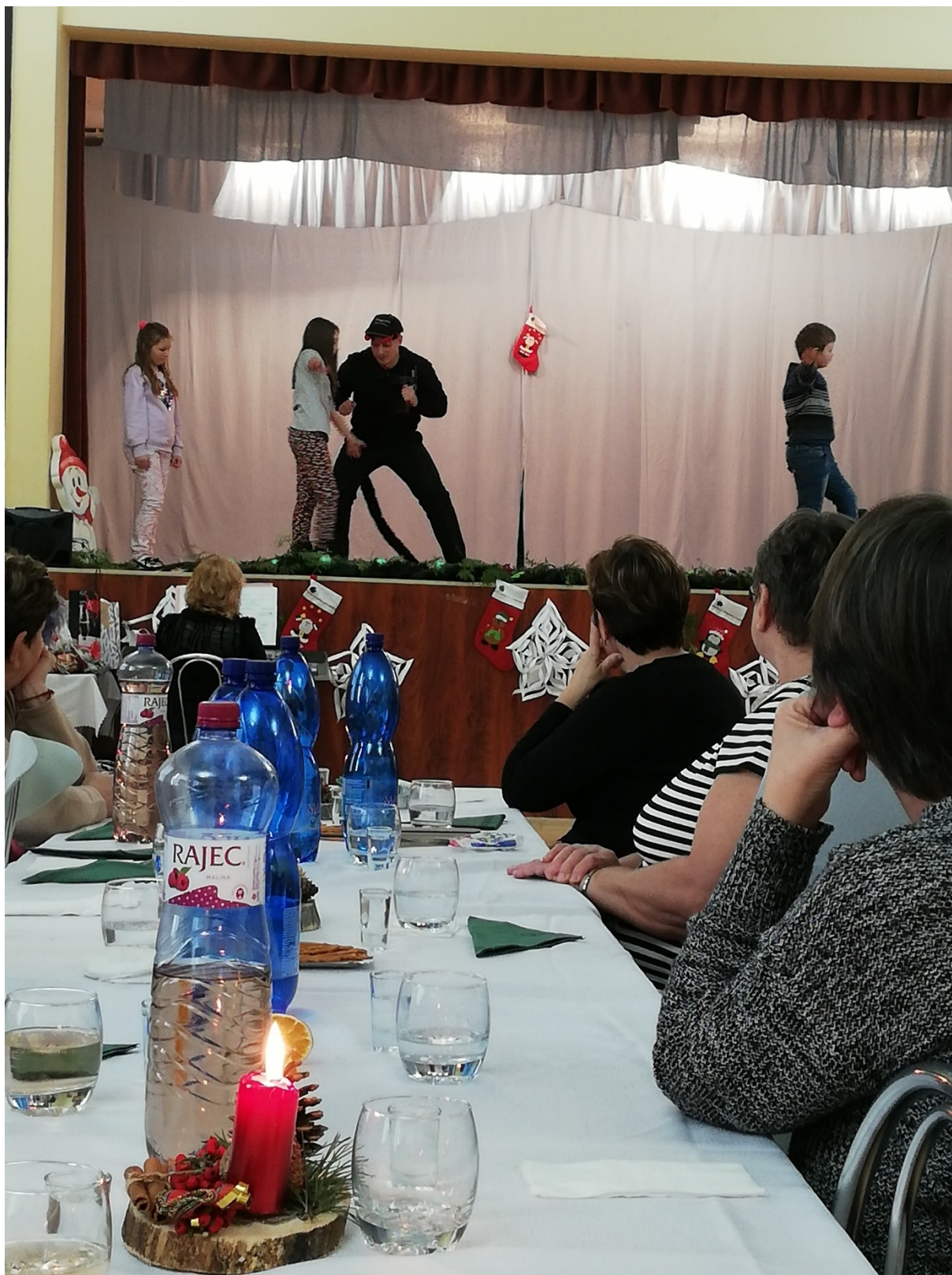
Členky Klubu žien sledujú divadelné predstavenie v podaní detského divadelného súboru Pod vežičkou V popredí jeden z adventných svietnikov zhotovený z prírodných materiálov členkami klubu