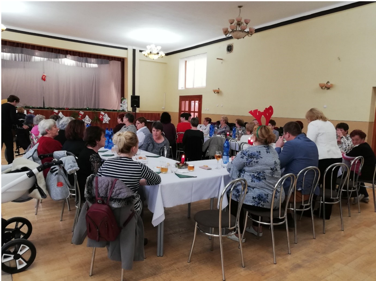
Členky Klubu žien prítomné na slávnostnej členskej schôdzi spojenej s Mikulášskym popoludním