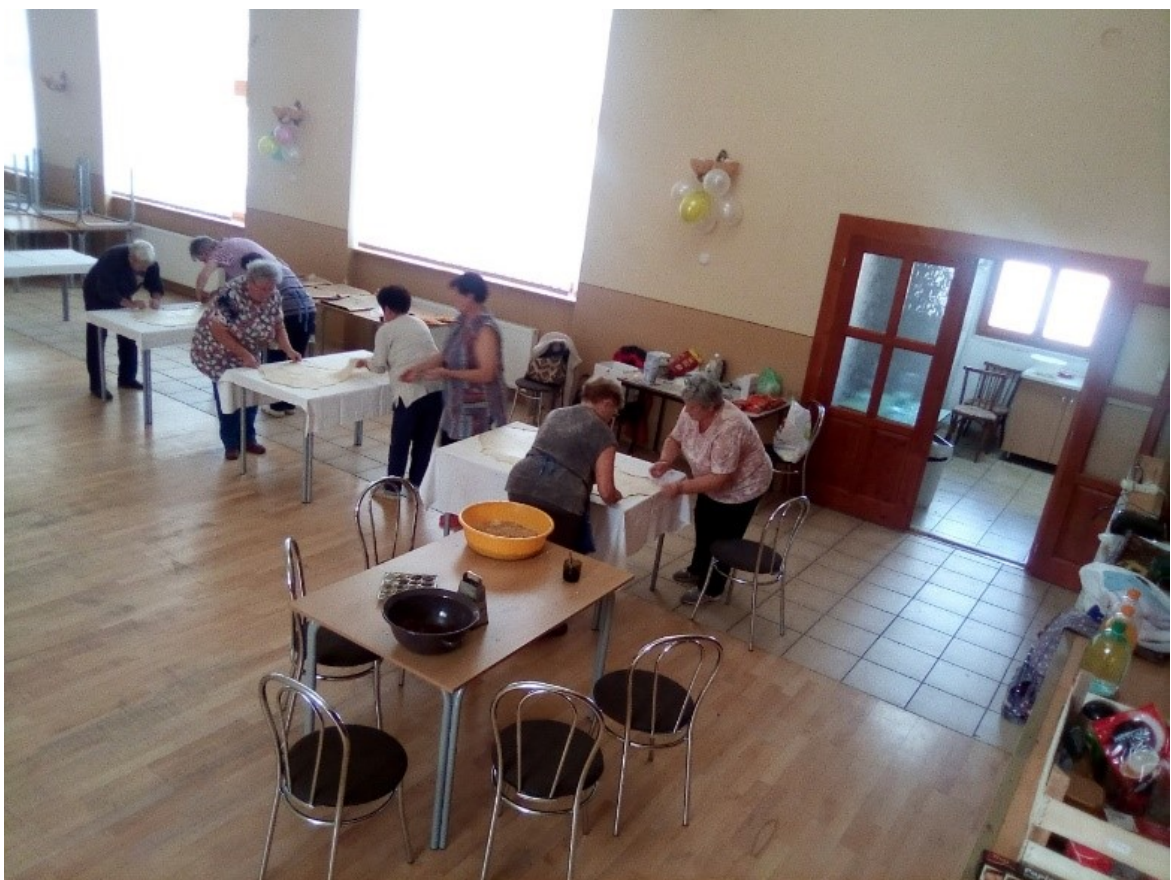
Vytahovanie štrúdlového cesta