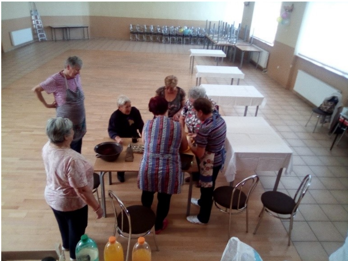
Práca pri strúhaní jabĺk a cedení višni do štrúdlí v družnej debaťe prítomných členiek klubu