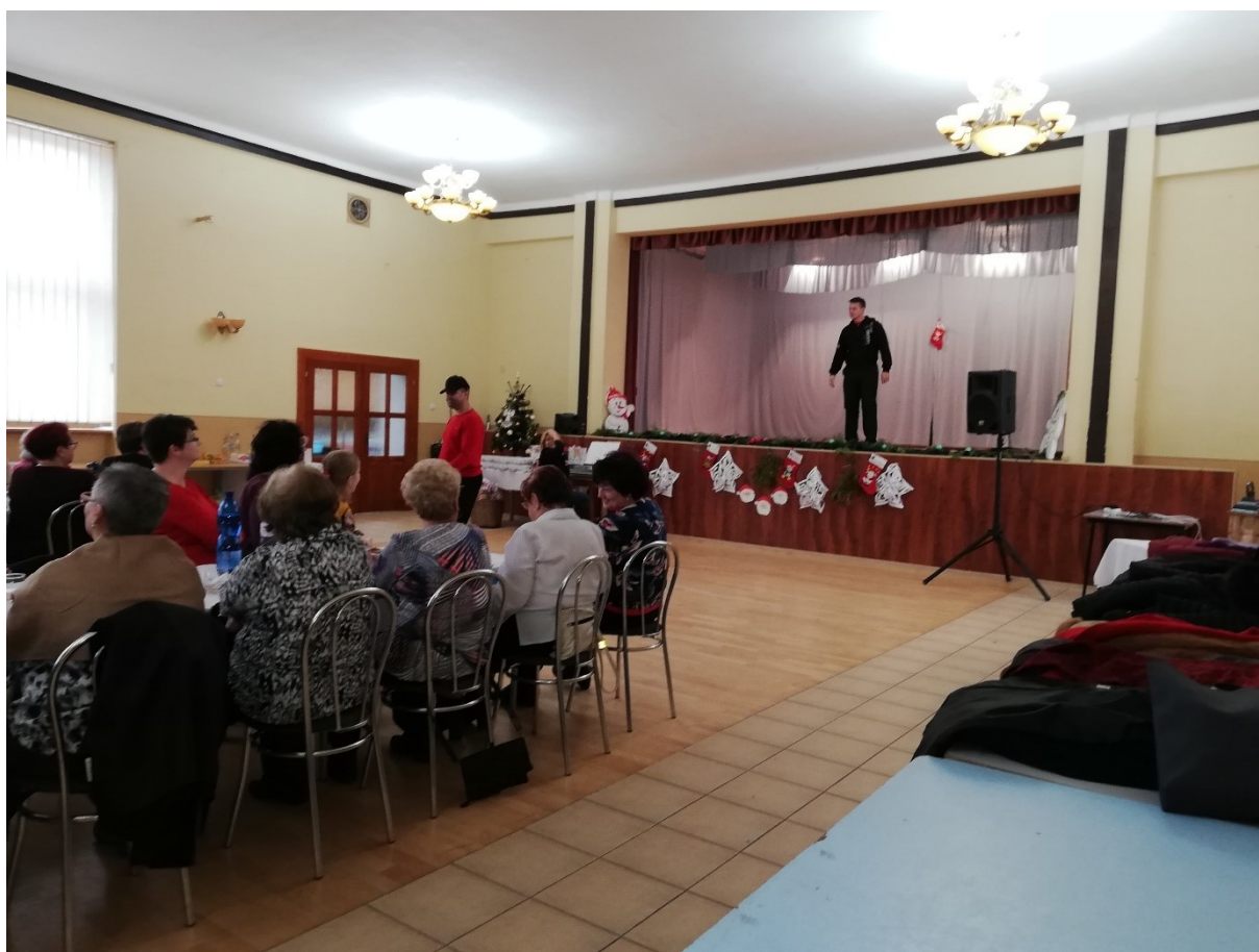
Členky Klubu žien sledujú divadelné predstavenie v podaní detského divadelného súboru Pod vežičkou

od predsedníčky a výboru Klubu žien dobrovoľne organizovaných pri OÚ v Lubeníku