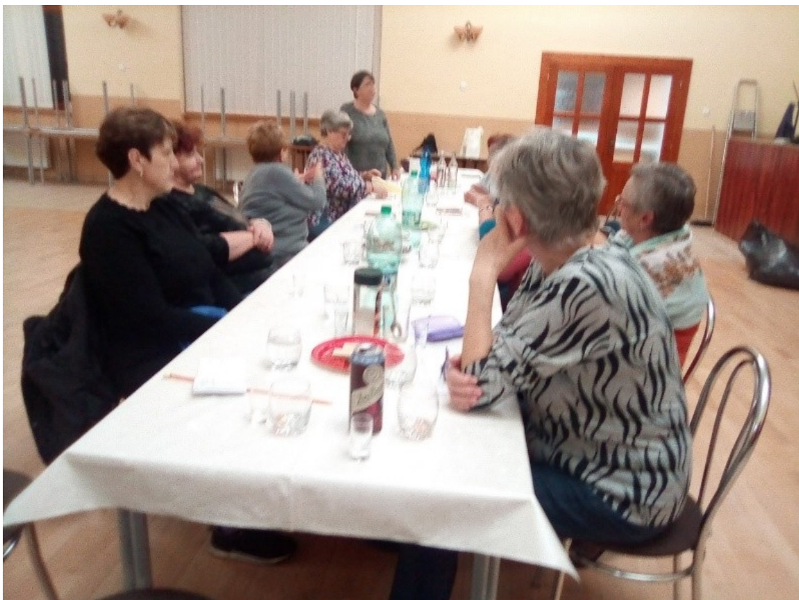
Členky Klubu žien prítomné na akcii