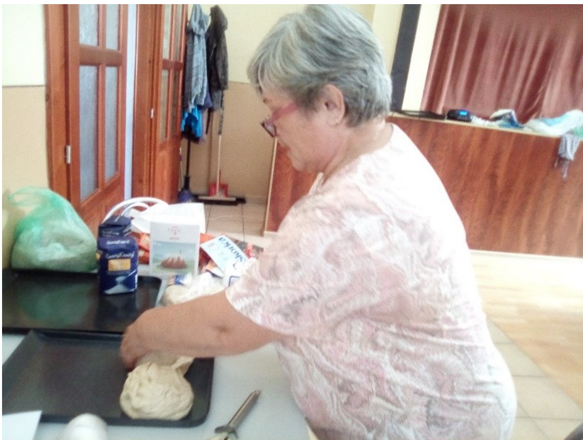
Delenie vymieseneho cesta na štrúdle na jednotlivé dávky k vyťahovaniu (D. Furmanová)