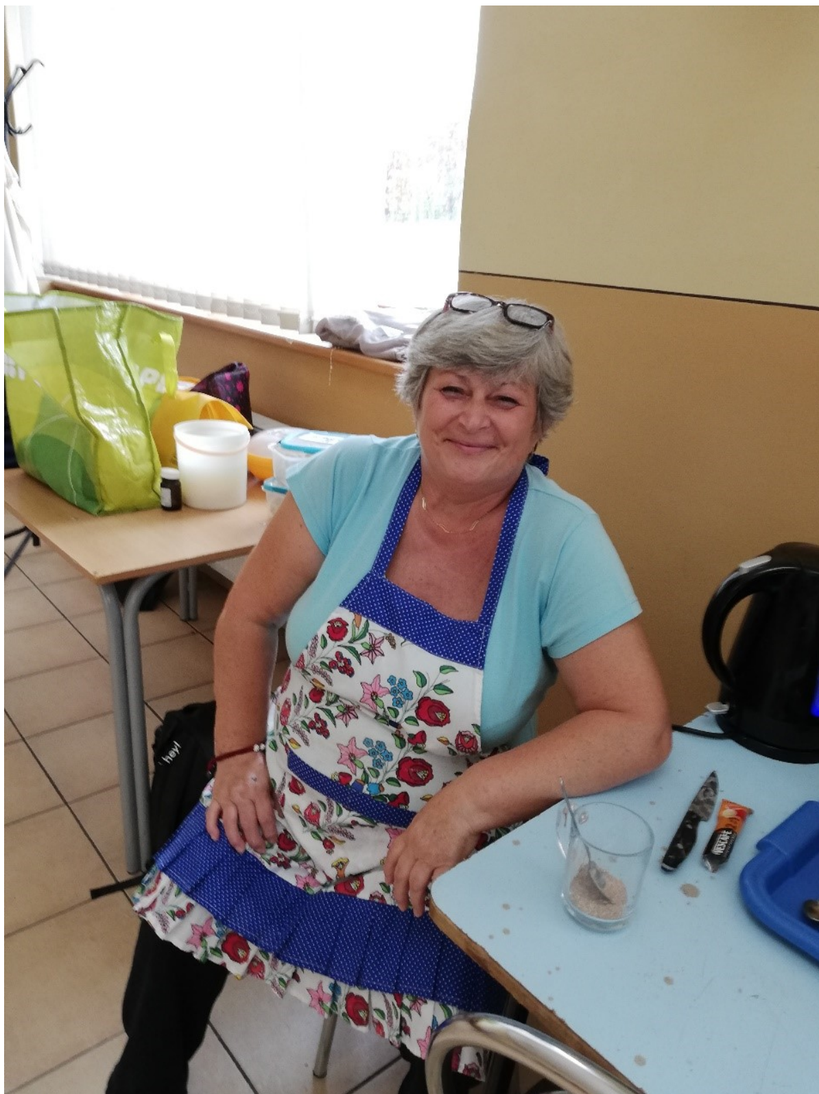
Chvil'ka oddychu a čakanie na zafiatie kávy (D.Furmanová)